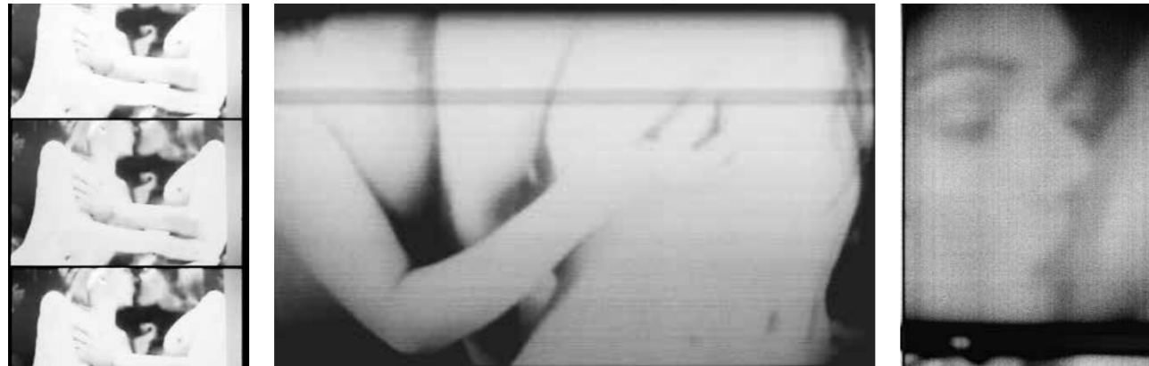
© Mélissa Boucher, 2021 Série Scrolling [faire défiler] Cam girls , extrait, 2121.

Diplômée des Gobelins en 2012 et des Beaux-Arts de Paris en 2013, Mélissa Boucher est une artiste franco-bolivienne qui développe ses projets en photographie, vidéo et dans des éditions d'artiste.