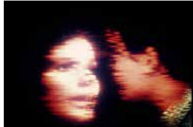
série Canal - circa 1985-1990