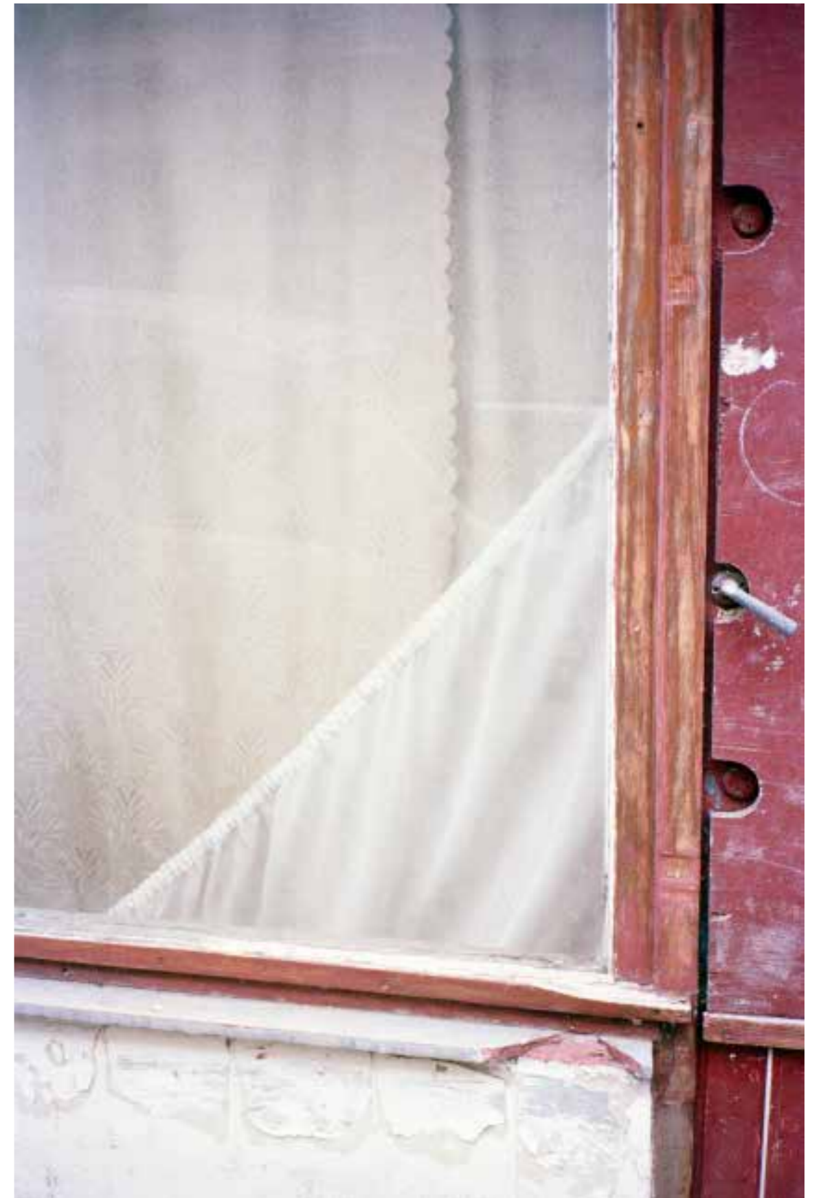
au coin de la rue, extrait - 2016

Elle part souvent d'intuitions, travaille dans la collecte et l'accumulation puis construis ou reconstruis a posteriori . Ses images existent finalement souvent dans le dialogue, mais aussi dans la confrontation voire dans la confusion avec d'autres genres et médiums, comme le cinéma ou la littérature. Dans ses derniers projets, elle travaille de plus en plus avec la matière de la pellicule ou des émulsions, n'hésitant pas à remanier ses images. Effacer, découper, agrandir, zoomer pour développer ainsi une cartographie du détail en cherchant l'image cachée dans l'image. Son nouveau projet mêle dans les images gestes et mots afin d'en révéler par la photographies, les sens cachés.