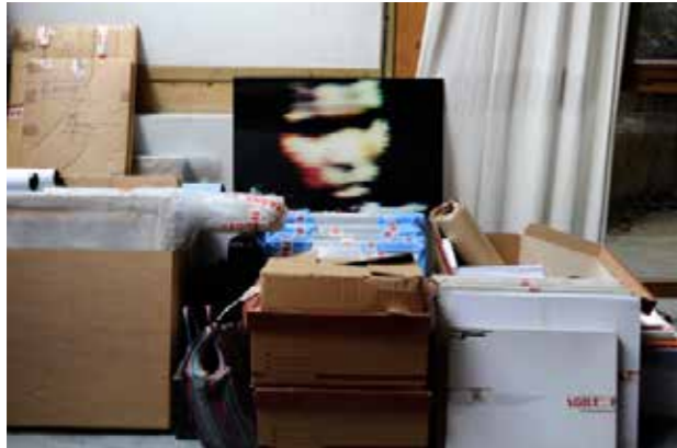
©Laure Vasconi, Paris, 2010, L'Après Jour , éditions Filigranes