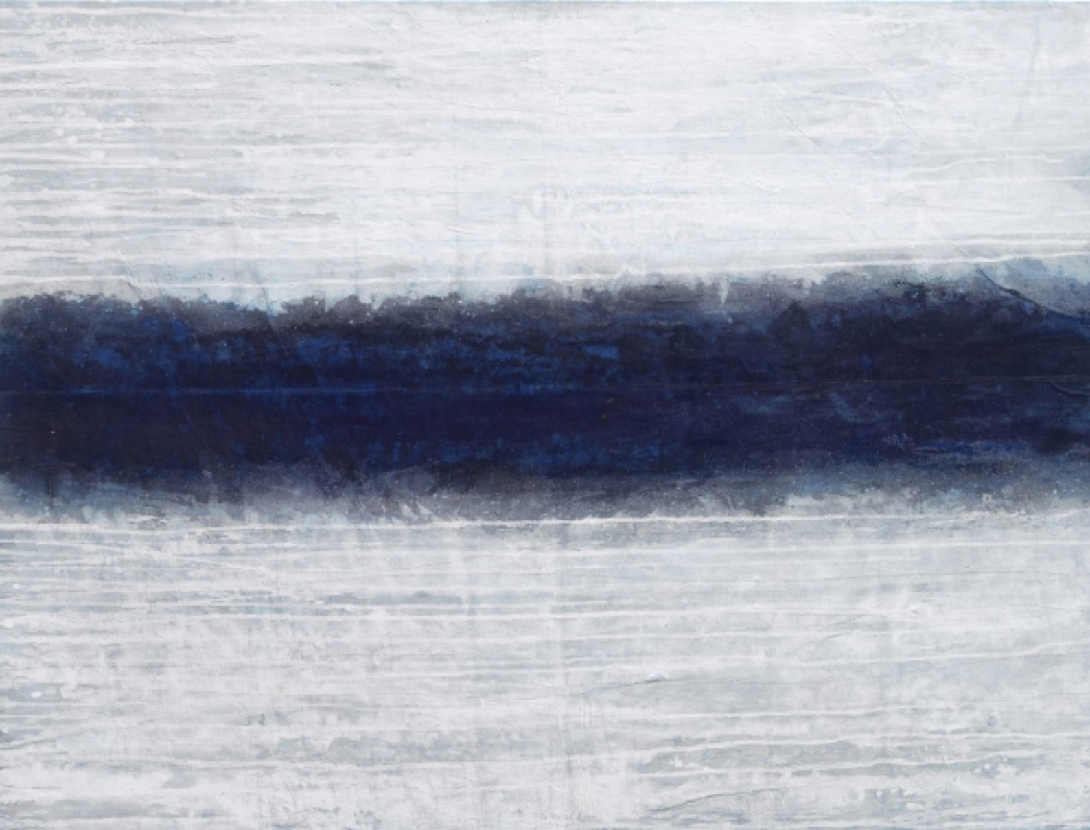
Le lac, le reflet, la forêt, le ciel, acrylique, encre et crayon noir sur toile. 100,5 cm x 132,5 cm, 2023