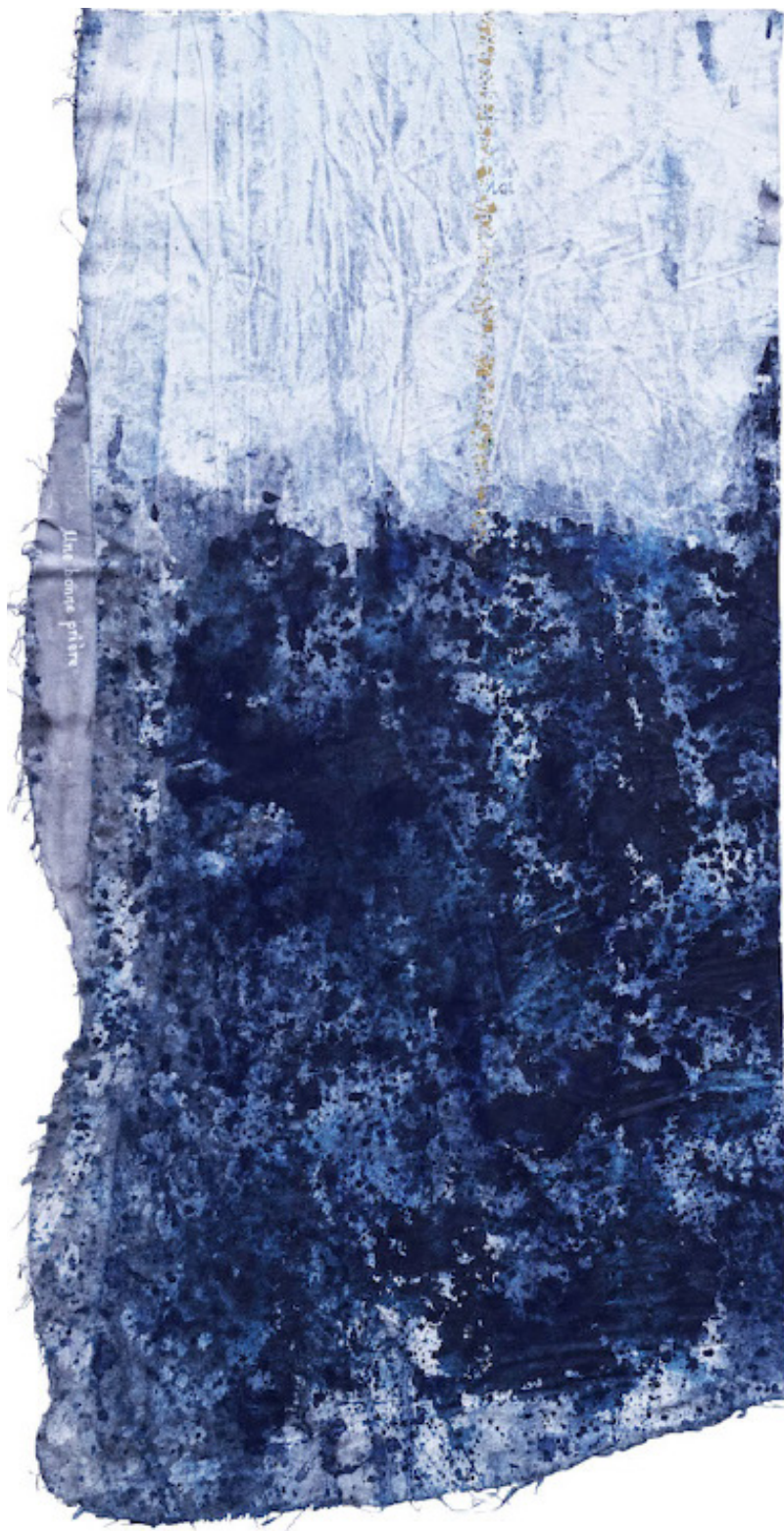
Une bonne prière, acrylique, stylo correcteur blanc, encre sur toile, 57 cm x 30 cm, 2022