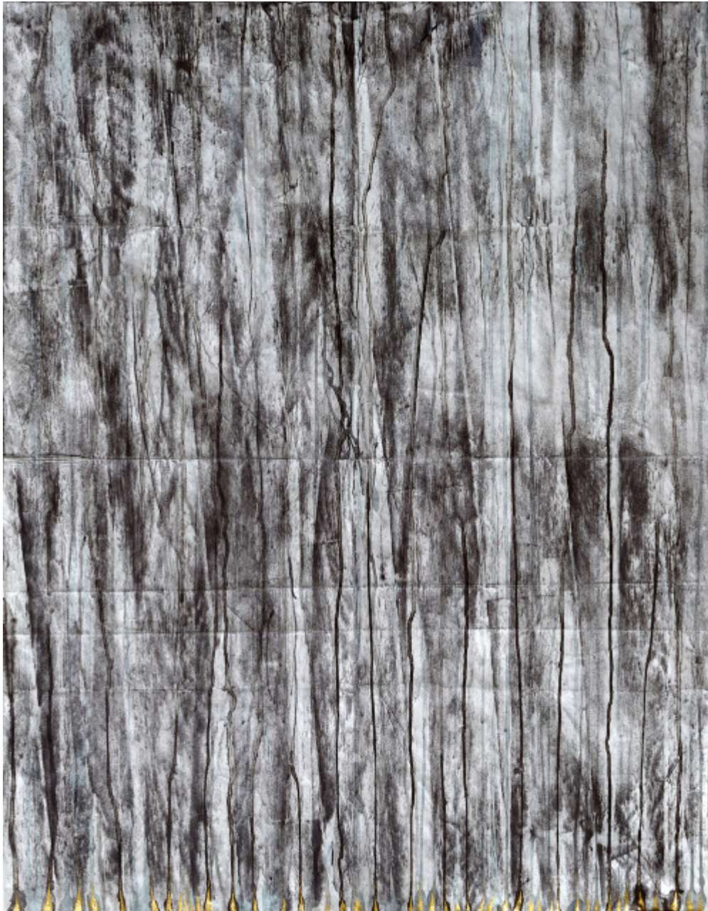
Le long de la paroi acrylique, feuilles d'or, encre et crayon noir sur papier, 107 cm x 83 cm, 2022