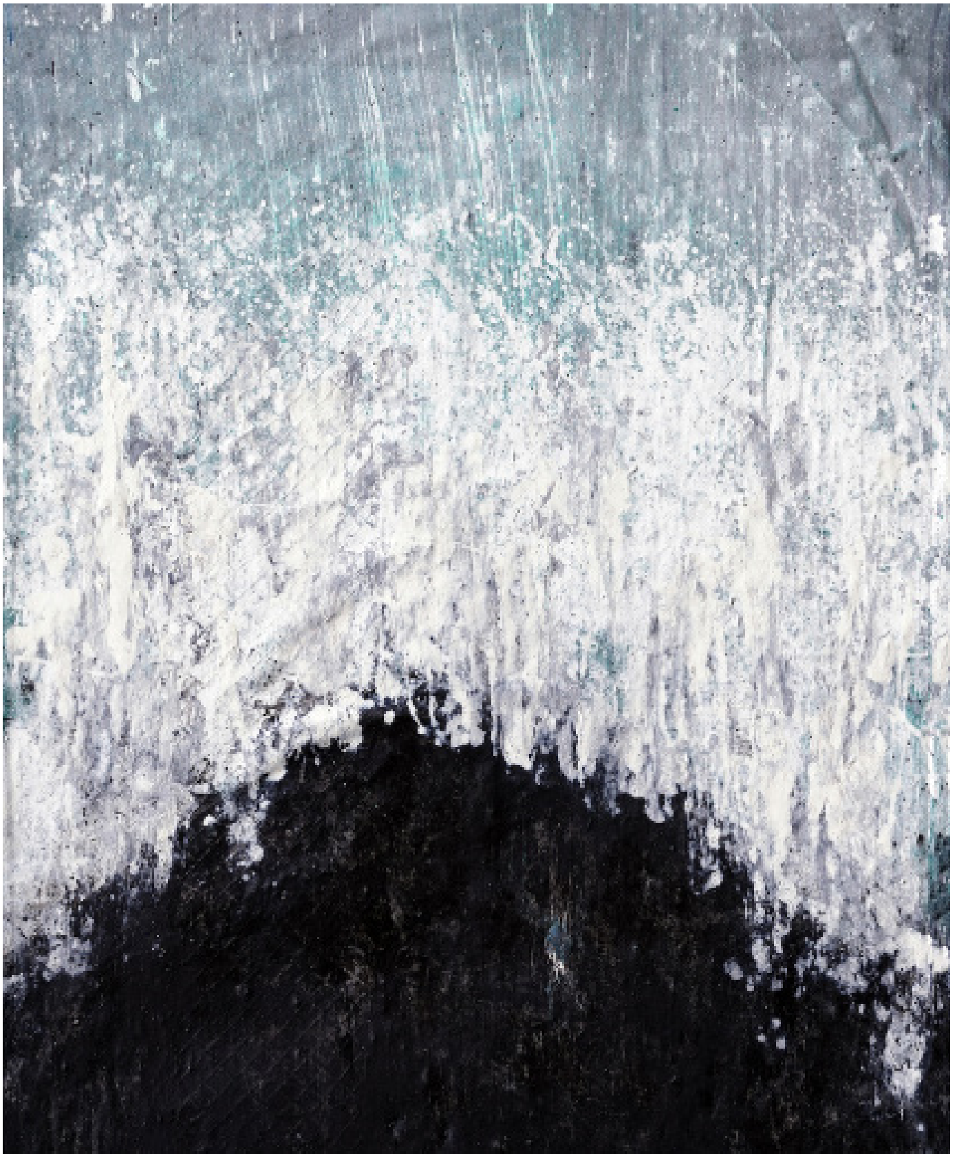
Le ciel dissous, acrylique, encre et crayon noir sur toile, 50 cm x 40 cm, 2023