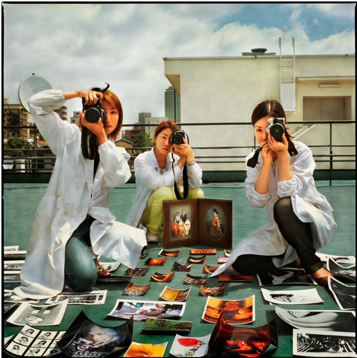
New Readings Portraits 2005